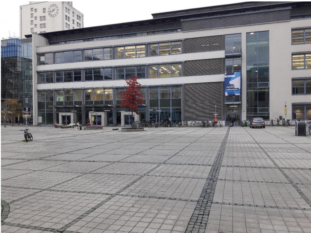
Foto des Vorplatzes für kleinere Gerätevorführungen im Außenbereich. Im Hintergrund das Tagungsgebäude der DGG 2024 in der Carl-Zeiss-Straße 3, 07743 Jena.